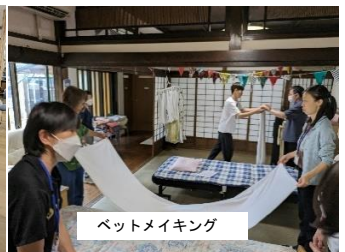
ベットメイキング

《お問い合わせ》 認定NPO法人生き生きネットワーク 〒420-0882 静岡市葵区安東1丁目23番12号